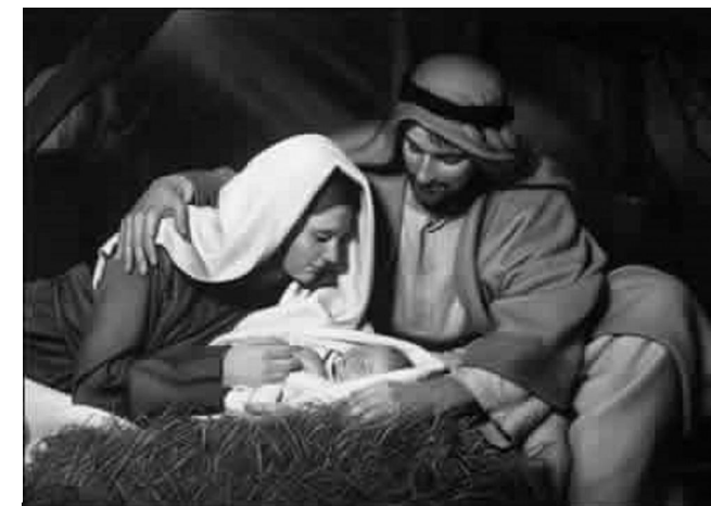
Sveiki sulaukę Šv. Kalėdų

Štai vieno vaiko mintys: „Vakar mane barė. Mama. Mane barė, o aš džiaugiausi. Iki šiol apie tai, kad vaikus bara, skaičiau tik knygose. Žinojau, jog bara už šunybes, kiaulystes ir nepaklotas lovas. Pasiutusiai būdavo įdomu, kaip jaučiasi baramas vaikas. Tačiau kad ir kiek stengiausi, nei mama, nei tėtis manęs nebardavo. Nenešioju šaliko ir pirštinių, tačiau niekam nerūpi, kaip rengiuosi. Nevalgau, tačiau niekas to nepastebi – kasdien pusryčiauju ir vakarieniauju vienas, o valgant savaitgaliais tėtis prie stalo skaito laikraščius, o mama pešiojasi antakius ir lakuojasi nagus. Tyčia gaunu blogus pažymius, tačiau nei mama, nei tėtis į pažymių knygelę nežiūri. Rytai jie skuba, vakarais grįžta vėlai ir beveik miegodami, savaitgaliais mama visą dieną kalba telefonu, o tėtis skaito žurnalą. Man liepia netrukdyti. Vakar mama netikėtai grįžo anksčiau. Pasakė, kad nuo šios dienos dirbs mažiau, todėl vakarais grįš anksčiau. Paaiškino, jog tai dėl krizės, kad mes nebegalėsime per atostogas važiuoti į Afriką, o tėtis naują automobilį pirk