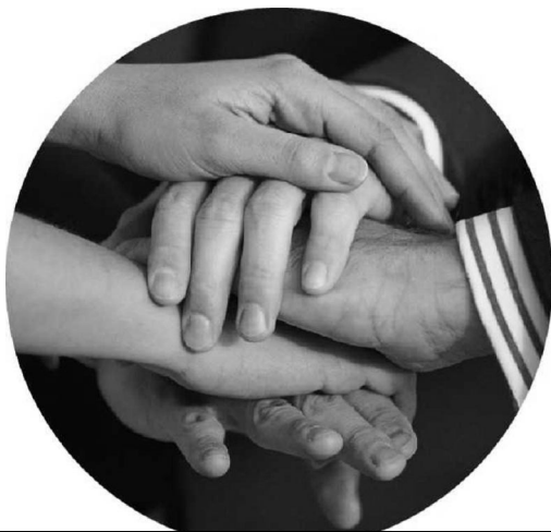
Pažindami vienas kitą stiprinsime savo bendruomenę

Labai prašome nesieti registravimosi parapijoje su koku nors finansiniu išpareigojimu. Mes tikimės Jūsų geros valios ir supratimo. Visi Jūsų pateikti duomenys bus naudojami statistiniams tikslams, jų konfidencialumą garantuojame.