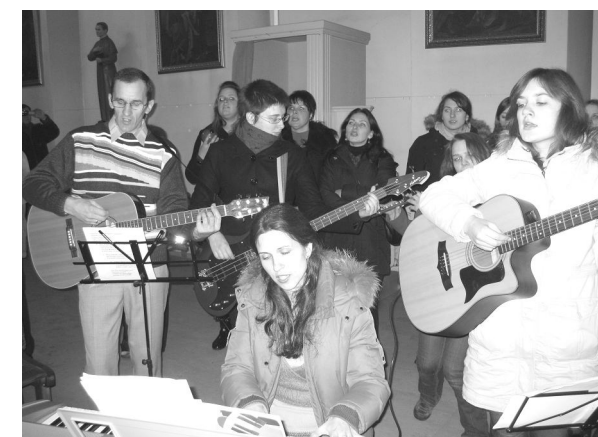
Jungtinė Jonavos parapijos ir „Tikėjimo žodžio“, bendruomenės šlovintojų grupė ekumeninėse pamaldose

Koordinuoti įvairių Bažnyčių maldas už vienybę ir jas rengti tuo pačiu metu pradėta 1935 metais“.