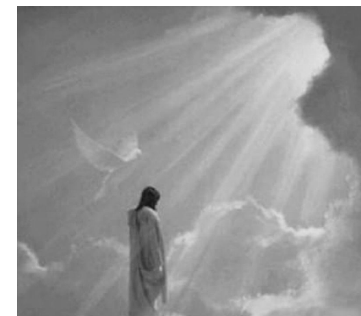
Ištikimas yra Dievas, kuris jus pašaukė į savo Sūnaus, mūsų Viešpaties Jėzaus Kristaus, bendrystę (1 Kor 1,9)