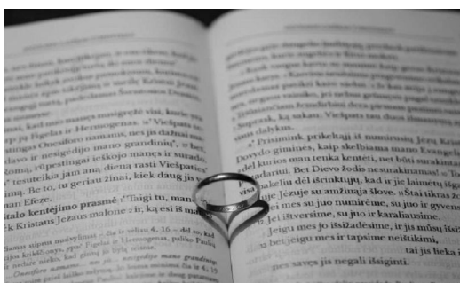
Viešpats yra ištikimas visais savo žodžiais ir maloningas visais savo darbais (Ps 145)