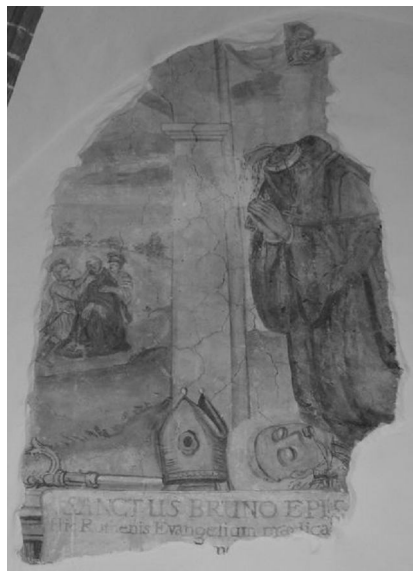
Šv. Brunono mirtis

Šv. Brunonas yra hagiografinių veikalų „Šv. Vaitiekaus gyvenimas“ (apie 1002-1004 m.) ir „Penkių brolių kankinių gyvenimas“ (1005-1006 m.) autorius. Šiuose kūriniuose jis glaustai aprašė pirmąsias katalikiškąsias misijas į Vidurio Rytų Europos pagonių